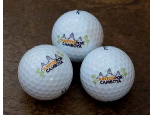
PELOTAS GOLF & CARMEN CARMONA-Spain