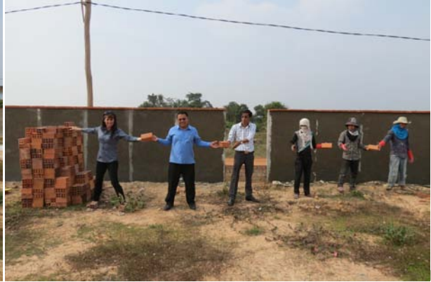
Título de propiedad está en su tierra.