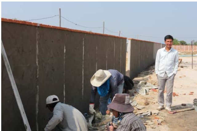
SIENG, Constructor & Team