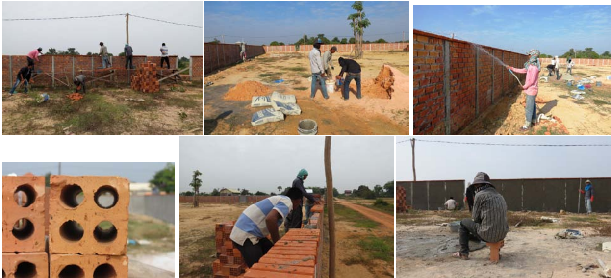
Finalizando muro de 130cm altura.