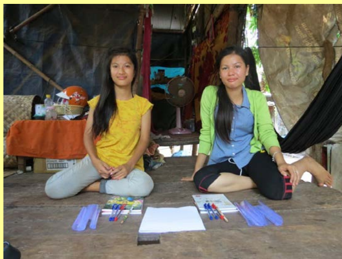
Imagen inferior dos hermanas a las que la ONG apoya en su educación y que residen con su familia.