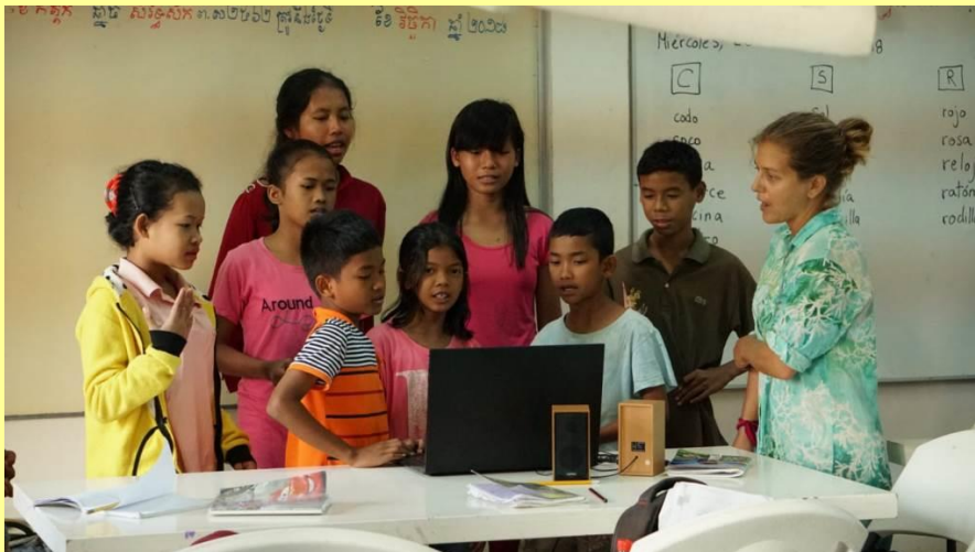
En la imagen dando una clase la profesora de Español.

Además en JAVI SCHOOL impartimos diariamente clases de inglés y de informática obligatorias para todos los niveles; y 3 veces por semana clases de español para todos los niveles de quienes quieren tener una segunda lengua extranjera de importancia. Todo ello se desarrolla con profesores locales y nativos, altamente cualificados y que disfrutan de su trabajo, brindando un alto grado de motivación a sus alumnos!.