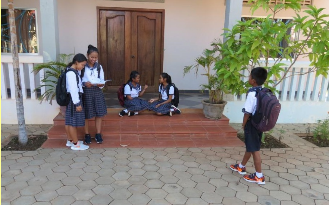
Alumnos que asisten a WESTERN INTERNATIONAL SCHOOL