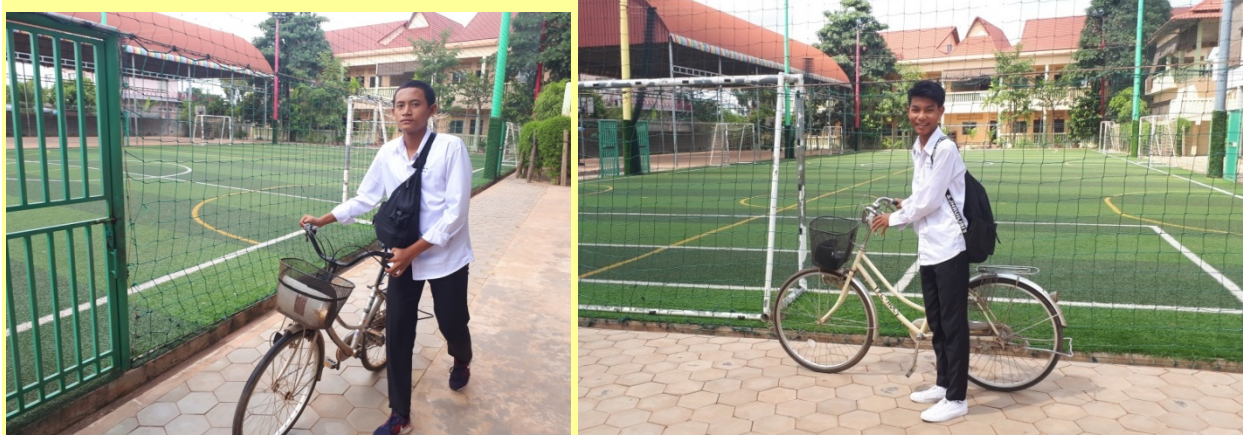
Imagen superior, estudiantes que residen en DEI KOMA-La Tierra de los Niños.

** Atendemos escuelas públicas y privadas, estando en función de los resultados académicos o del nivel de compromiso. También tenemos un programa de Becas en aldeas, los estudiantes continúan viviendo con sus familias, sin necesidad de desapego familiar hasta alcanzar cursos de nivel técnico o universitario.