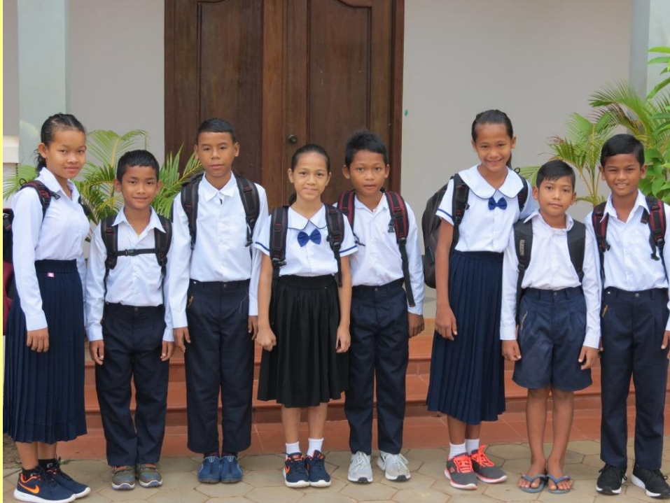
Felices los estudiantes de Cuarto de Primaria.

Además en JAVI SCHOOL impartimos diariamente clases de inglés y de informática obligatorias para todos los niveles; y 3 veces por semana clases de español para todos los niveles de quienes quieren tener una segunda lengua extranjera de importancia. Todo ello se desarrolla con profesores locales y nativos, altamente cualificados y que disfrutan de su trabajo, brindando un alto grado de motivación a sus alumnos!.