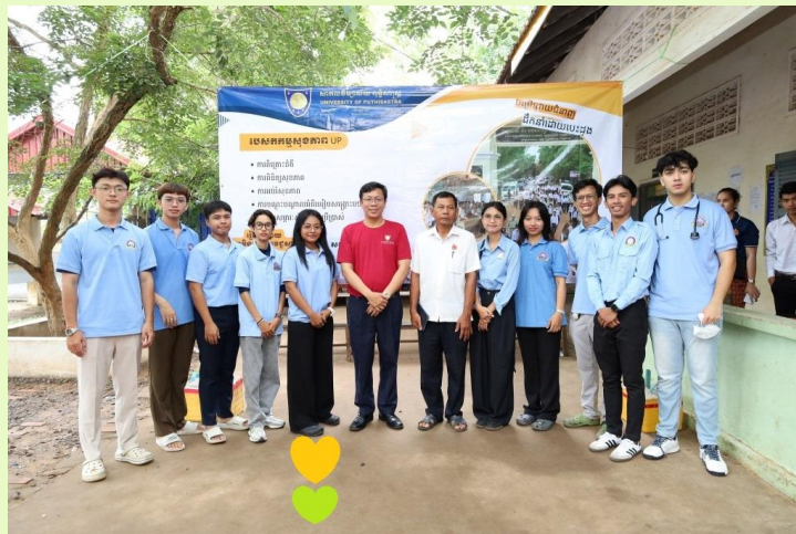
Nueva generación de futuros médicos jemerres.

El progreso de la calidad para la salud pública de Camboya en vuestras manos.